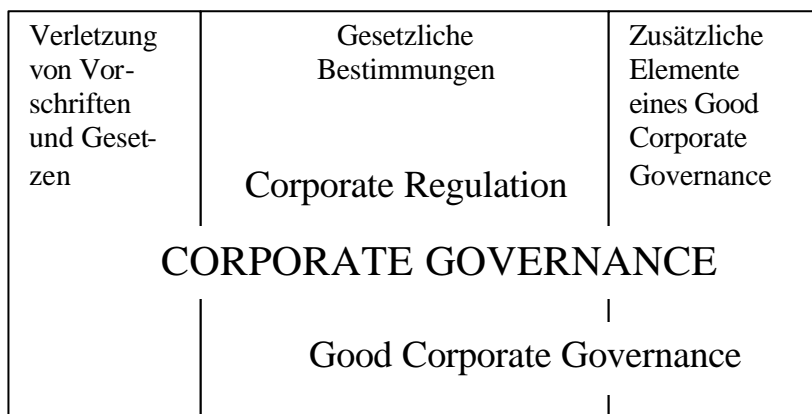
Abb. 1: Der Zusammenhang zwischen Corporate Governance und Corporate Regulation

tion) und einem „Good Corporate Governance“ werden aus Abbildung 1 deutlich. Leitlinien, Prinzipien und Codes einer guten Corporate Governance können auch als Hilfestellung dafür aufgefasst werden, zu entscheiden, ob Abweichungen von den gesetzlichen Bestimmungen und Nutzung von Freiräumen gesellschaftlich erwünscht oder unerwünscht sind. Diese Frage ist oft nicht einfach zu beantworten. So kommen einige Beobachter beim Deutschen Corporate Governance Code sogar zu dem Urteil, dass dieser unter den gesetzlichen Standards bleibe 1 . Codes können also auch instrumentalisiert werden, um gesetzliche Bestimmungen in Frage zu stellen und um Interessenpolitik zu betreiben.